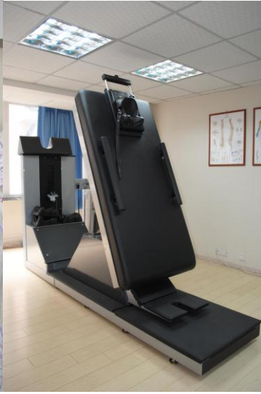
颈椎脊柱减压治疗仪