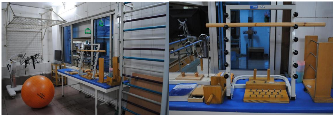
作业治疗训练用具