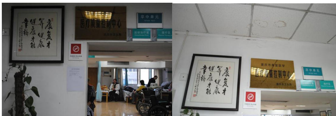
运动治疗和物理治疗室