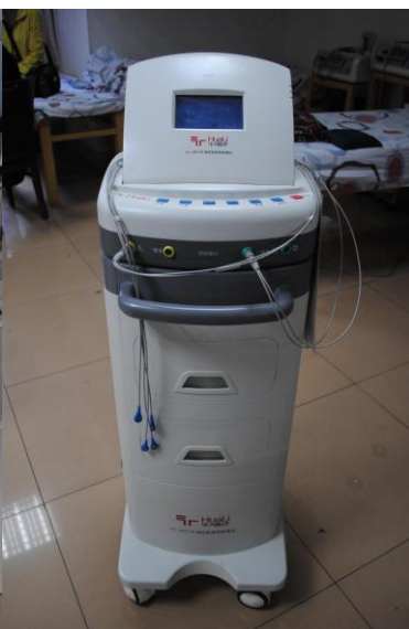
神经系统电刺激仪