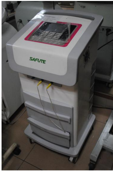
产后康复综合治疗仪