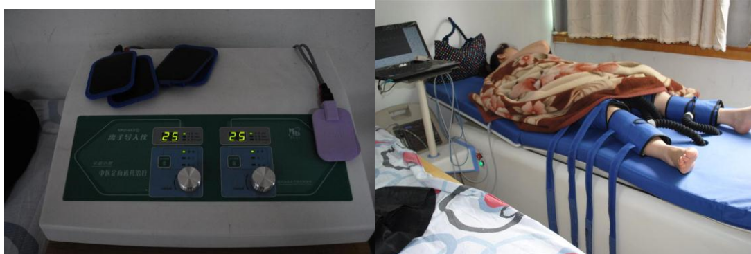
中医定向透药治疗仪