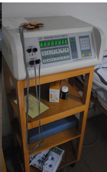
立体动态干扰电疗仪