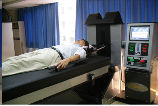
非手术脊柱减压系统