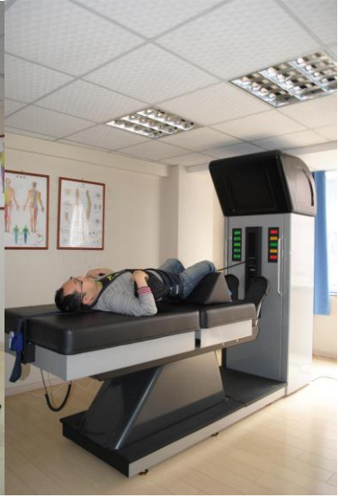
腰椎脊柱减压治疗仪