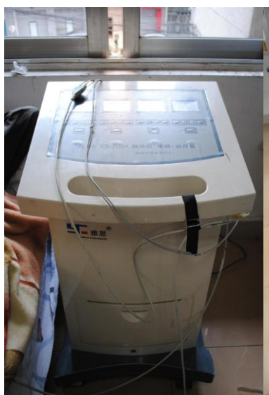
脑功能障碍治疗仪